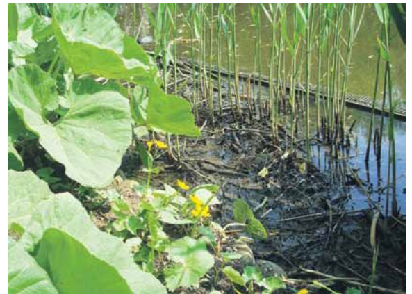
foto boven: dotters bloeien in het Sarphatipark. Onder: Jac.P. Thijsse Park

Maaltijdsaladebakken gevraagd Dotterbloemen laten zich heel goed opkweken in de doorzichtige maaltijdsaladebakken die in sommige supermarkten te koop zijn. Als u dit soort bakken over heeft, kunt u ze altijd naar het Groene Gemaal in het Sarphatipark brengen.