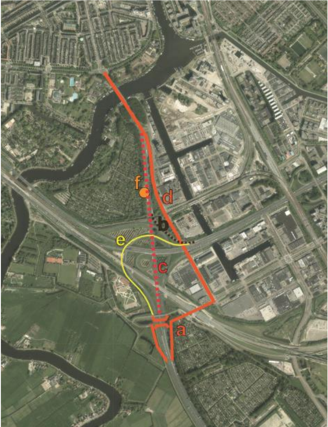
Kaart 1: luchtfoto met de onderzoeksscope van de nieuwe A2-Entree met de verschillende onderdelen ervan