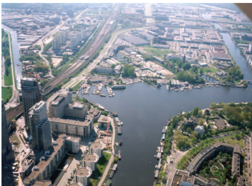
Overamstel in vogelvlucht

Het projectbureau Zuidoostlob van de gemeente Amsterdam ontwikkelt het project Overamstel; het gebied tussen de Amstel, de Nieuwe Utrechtseweg, de metrolijn, de penitentiaire inrichting en de Weesperrekvaart. Overamstel is een gebied met grote kwaliteiten: gelegen in een bocht van de Amstel en nabij de uitvalswegen en diverse OV-knooppunten, naast de populaire woonwijken Watergraafsmeer en Rivierenbuurt en op steenworp afstand van het centrum. Met de vaststelling van het structuurplan Amsterdam 'Kiezen voor Stedelijkheid' 2003 is gekozen om op delen van Overamstel naast bedrijven ook een gemengd woon/werkgebied te ontwikkelen. Op 25 januari 2005 lichtte het projectbureau Zuidoostlob bewoners en gebruikers van het gebied Overamstel in over de planontwikkeling. In deze eerste nieuwsbrief wordt de huidige stand van zaken weergegeven.